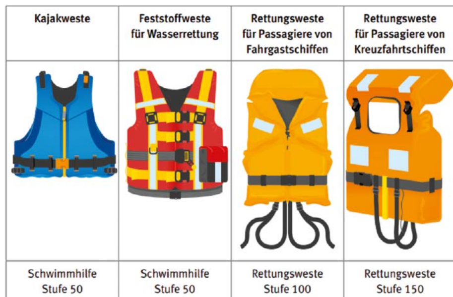
Abb. 2: Typische Schwimmhilfen und Feststoff-Rettungswesten für Passagiere von Schiffen