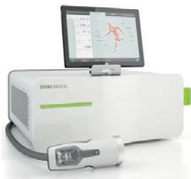
DUOLITH® SD1 T-TOP »F-SW ultra«