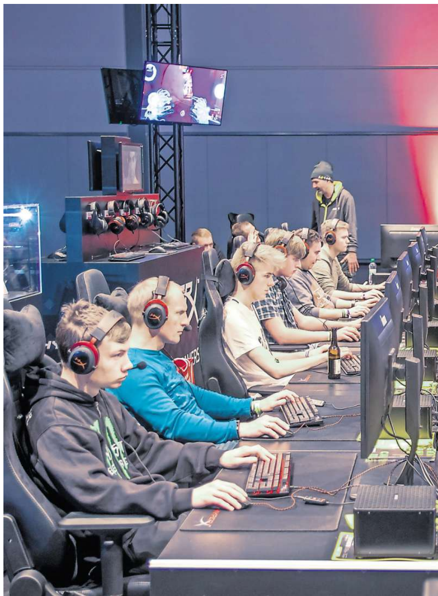
Sitzfleisch ist Trumpf. Gamer-Sport wird auch in Deutschland immer beliebter.

E-Sport könnte bald olympisch werden – in Südkorea ist er bereits ein Massenphänomen