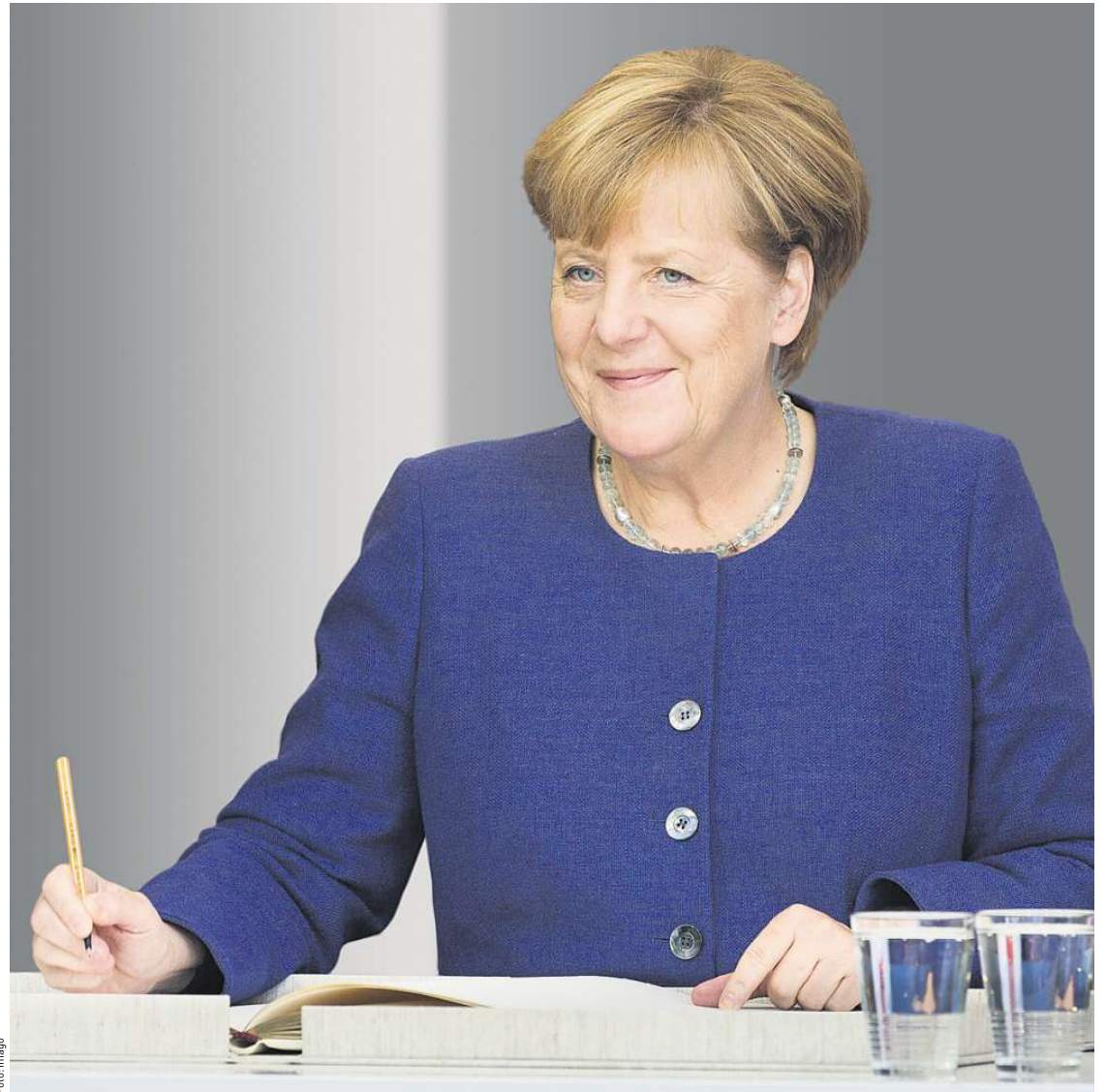
Angela Merkel, 63, reist nicht zu den Paralympics, verfolgt einige Wettkämpfe aber im Fernsehen.

Die Bundesregierung kann Inklusion unterstützen, aber nicht vollständig steuern. Wir brauchen noch mehr Bewusstseinswandel in der Gesellschaft, um weg von der bloßen Fürsorge und hin zu einer selbstbestimmten Teilhabe behinderter Menschen zu kommen. Das fängt im Kindergarten an und setzt sich in Schule, Ausbildung und Arbeit fort. Wir finden heute viele ermutigende Beispiele für inklusives Zusammenleben in unserer Gesellschaft, so auch im Sport. Besonders schätze ich das Engagement von Menschen mit Behinderungen und ihrer Verbände. Nach dem Motto „Nichts über uns ohne uns“ gestalten sie inklusive Prozesse mit. Ihr Rat und Sachverstand haben bei der Entwicklung des Bundesteilhabegesetzes sehr geholfen.