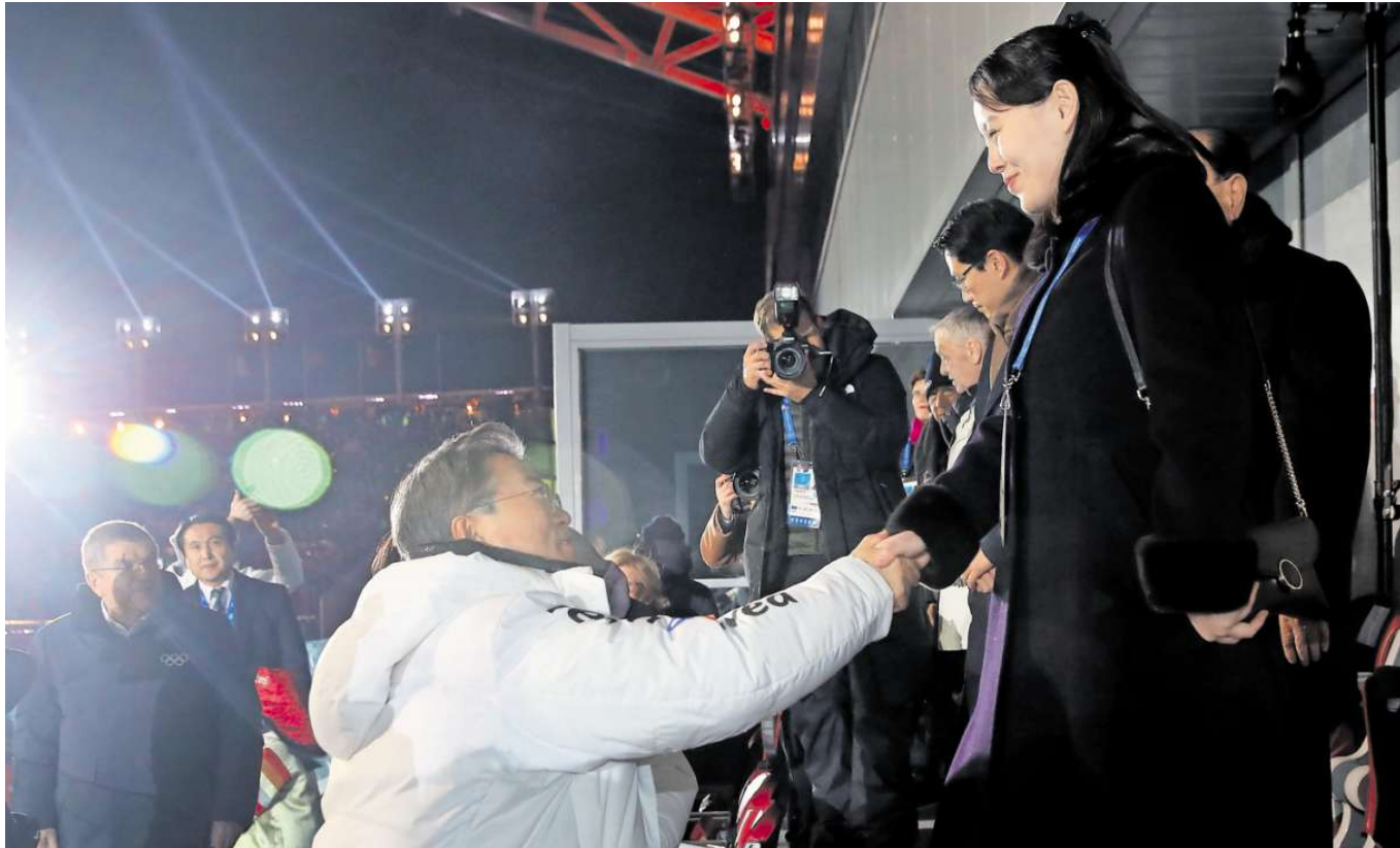
Historischer Handschlag. Südkoreas Präsident Moon Jae In begrüßt Kim Yo Jong (rechts), die für das Regime aus Nordkorea anreiste.

Eine simple Geste der Begrüßung, deren Bedeutung aber kaum größer sein konnte: Bei der Eröffnungsfeier der Olympischen Spiele reichte der südkoreanische Präsident Moon Jae-in der Schwester des nordkoreanischen Diktators Kim Jong-un seine Hand, beide lächelten. Eine historische Begegnung. Kim Yo-jong ist damit das erste Mitglied der Kim-Dynastie gewesen, das Südkorea seit dem Waffenstillstand von 1953 besuchte. Südkorea, zum zweiten Mal seit 1988 Gastgeber von Paralympischen Spielen und seit dem Koreakrieg vom Norden abgeschnitten, hat die Hoffnung auf eine Wiedervereinigung noch nicht aufgegeben. Provokationen durch Raketen- und Atomtests seitens Kim Jong-un hatten den Konflikt immer wieder verschärft – die Handreichung könnte ein neuer Anfang sein. Die südkoreanische Gesellschaft sehnt sich nach Frieden und wieder mehr Demokratie. Noch nicht vergessen sind die innenpolitischen Unruhen vor etwas mehr als einem Jahr, nachdem Präsidentin Park Geun-hye wegen Korruption ihres