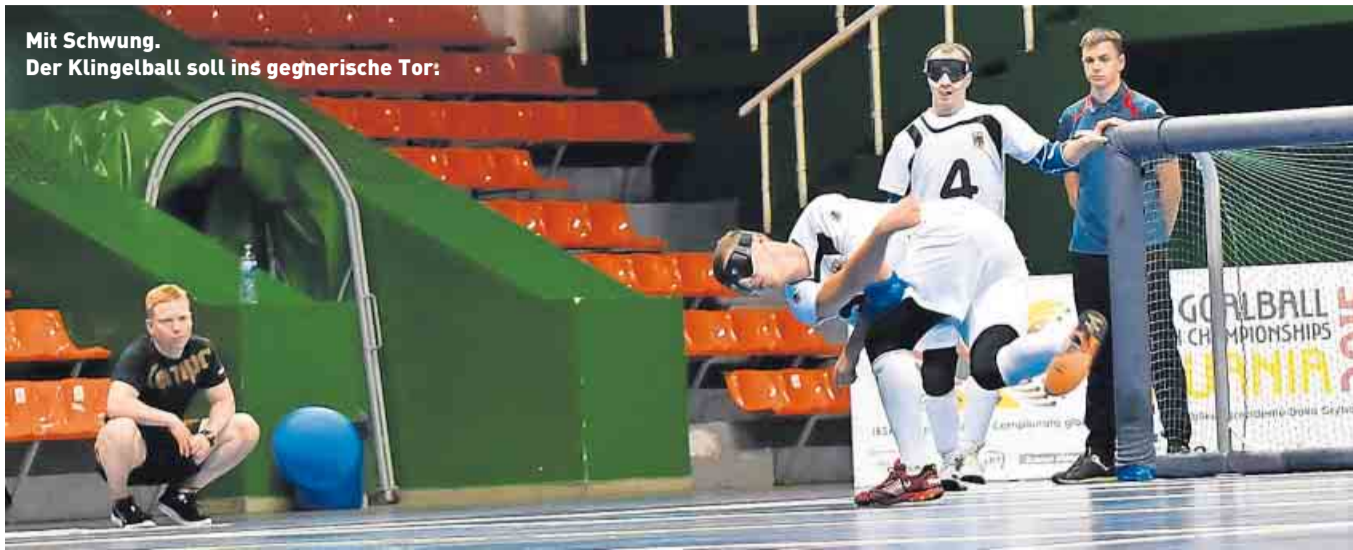
Mit Schwung. Der Klingelball soll ins gegnerische Tor: