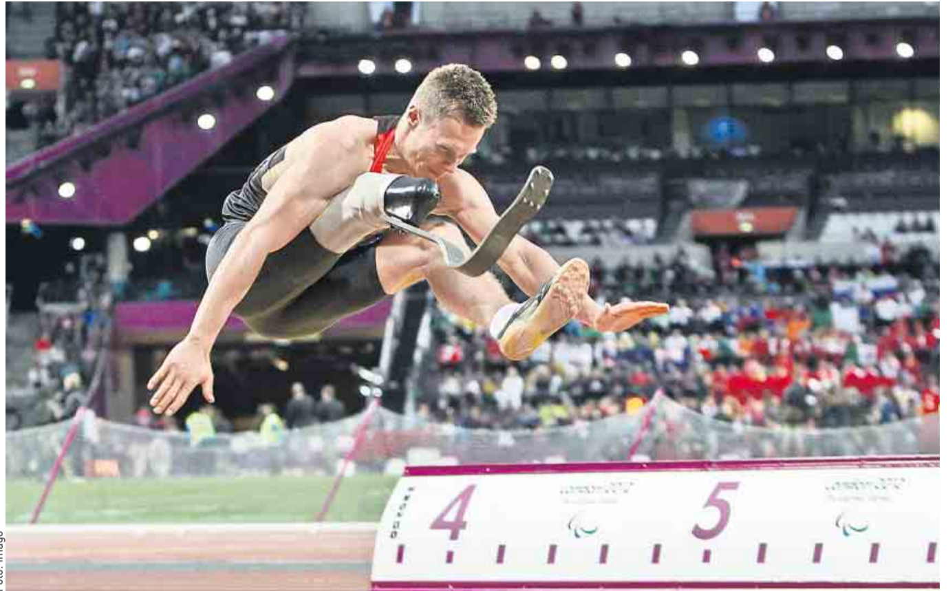
Markus Rehm gewann bei den Paralympics 2012 in London Gold. Das möchte er in Rio wiederholen.

Der inzwischen 28-jährige Rehm ist der beste paralympische Weitspringer der Welt. Seine Konkurrenten springen einen Meter kürzer als er. Im Juli 2014 gewann er die Deutschen Meisterschaften der Nicht-Behinderten. Den deutschen Rekord für Nicht-Behinderte hat Lutz Dombrowski 1980 aufgestellt: 8,54 Meter. So viel fehlt Rehm nicht mehr. Mit 8,40 Me-