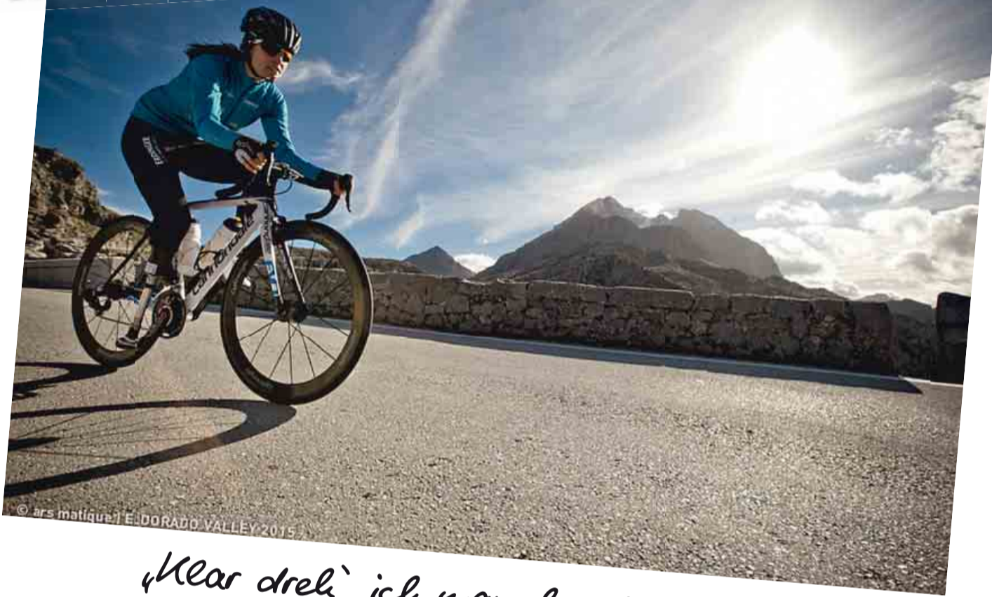
© ars matique | EL DORADO VALLEY 2015

WIR FÜR DEUTSCHLAND www.deutsche-paralympische-mannschaft.de